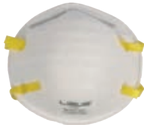
NIOSH N95 FDA

Respirador descartable para partículas N95.