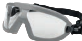
IRAM EN166 ANSI Z87.1 (Z87+)