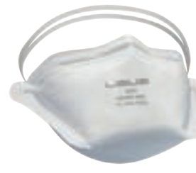
NIOSH TC- 84A-9317 FDA

Respirador descartable plegable para partículas N95.