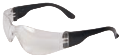
IRAM EN 166 ANSI Z87.1 (Z87+)