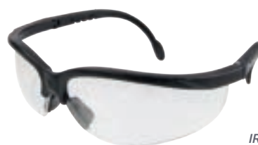
IRAM EN 166 ANSI Z87.1 (Z87+)

Lentes de seguridad medio marco con puente nasal.