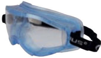
IRAM EN166 ANSI Z87.1 (Z87+)