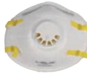
NIOSH N95 FDA

Respirador descartable para partículas N95 con válvula.