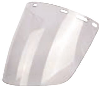
IRAM EN166 ANSI Z87.1 (Z87+)

Protector facial transparente rolado policarbonato.