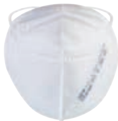
ABNT NBR 13698:2011 FDA

Respirador descartable para partículas Pff2/N95.