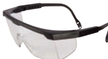
IRAM EN 166 ANSI Z87.1 (Z87+)